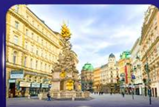
คาร์ทเนอร์ สตรีท เวียนนา