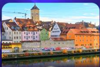
ย่านเมืองเก่า เรกนสบวร์ก