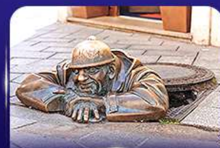
รูปปั้นคูนิล ปราติสลาวา