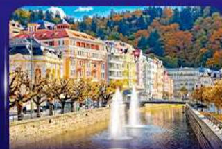
เมืองแห่งสปา คาร์ลส์ วารี