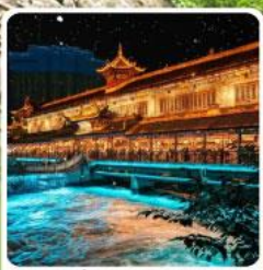
Blue Tears สะพานหนานเฉียว