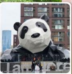
แพนด้าปิ่นตัก IFS