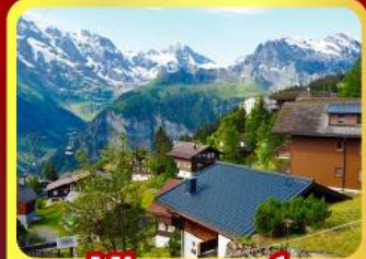
หมู่บ้านเมอร์สเรน