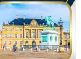
พระราชวังมาเลเซียนบอร์ก

ล่องเรือสำราญ DFDS • ลิตเติ้ลมอร์เมด • พระราชวังคริสเตียนบอร์ก • มหาวิทยาลัยออสโล • อนุสาวรีย์คาร์ลสตัด • ถนนคนเดินดรอกนิงกาดัน • ย่านบูฮาวน์ • ถนนสตรอเยก