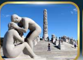
สวนอุทยานฟรอกเนอร์