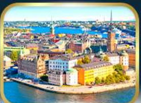
เที่ยวเมืองสตอกโฮล์ม