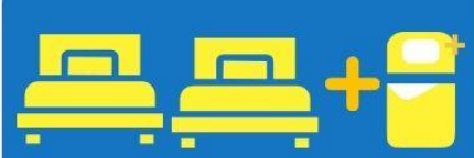
เตียง 3 ท่าน ที่นอนเสริม TRIPLE